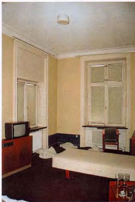
Hörnrum mot torget och Kyrkogatan. Del av en större f.d. 2-rumssvit med påkostad inredning.