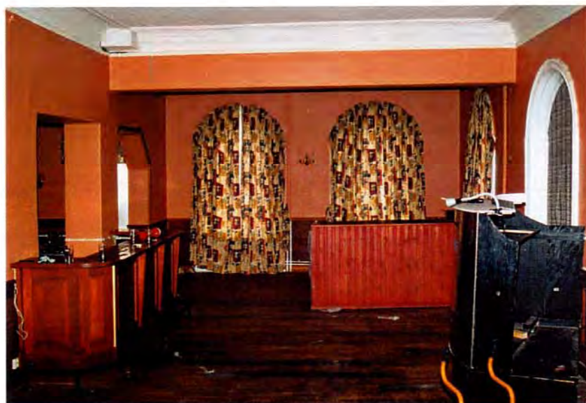
F.d. cafélokalen. Fönster med smygpanel, putsad, profilerad taklist.

Flygeln mot Kyrkogatan har mittkorridor omgiven av resanderum som till stor del präglas av en modernisering omkring 1940. Ursprungliga detaljer i form av fönsterfoder finns dock kvar. I hörnrummet med fönster mot både torget och Kyrkogatan finns dessutom smygpanel och