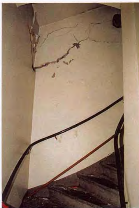
Kökstrappan vid anslutningen mot tillbyggnaden. Sprickor i mur.