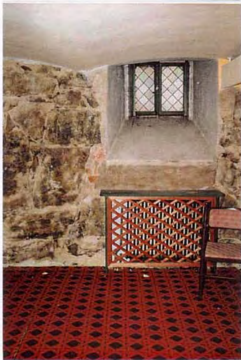
Källaren, fönster mot torget. Brandsäkert bjälklag från 1879.

Sammantaget sett har byggnaden ett mycket stort kulturhistoriskt värde. Den är av omistligt värde för stadsbilden. Den går helt enkelt inte att ersätta. Även invändigt har byggnaden stora kulturhistoriska värden, det gäller i synnerhet stora salen som också måste betraktas som omistlig i sammanhanget. Byggnaden är genom sina material och konstruktionsmetoder också en mycket tydlig illustration av det sena 1800-talets moderna byggnadsteknik.