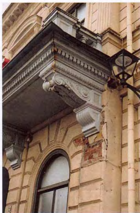
Detalj av balkong. Frostsprängningar i putsen.