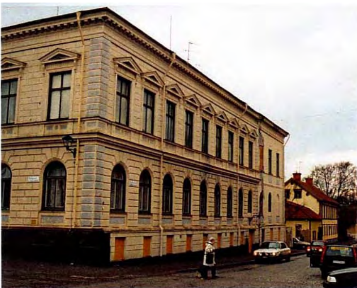
Fasad mot Kyrkogatan.

Formmässigt har tillbyggnaden från 1929 mycket väl anpassats till den äldre delen.