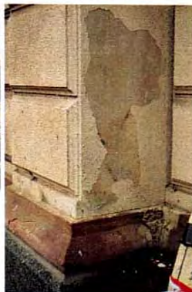
Detalj av sockel och puts. Under plastfärgen finna ursprunglig kalkfärg.