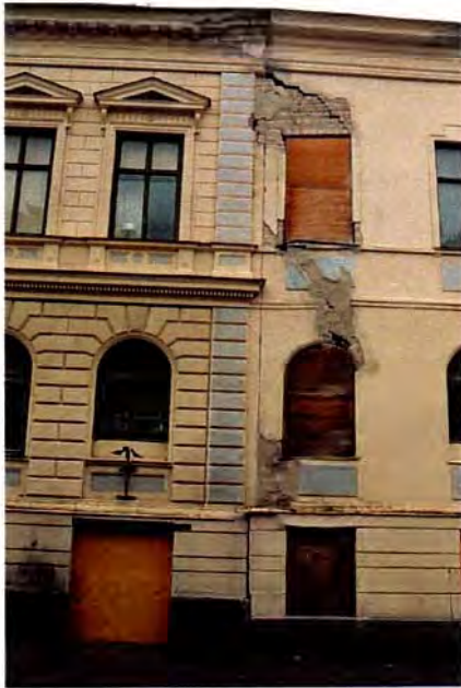
Den kraftigaste sprickan finns i skarven mellan tillbyggnaden och den ursprungliga byggnaden.

Stadshotellet har genom åren genomgått åtskilliga invändiga ombyggnader. Särskilt stora är de invändiga förändringarna i den del som på senare år använts som restaurang och diskotek. Där har stora håltagningar i murverk gjorts för att få ett mer öppet rumssamband. Vid en närmare genomgång av huset upptäcker man dock att en hel del av den ursprungliga inredningen och planlösningen ändå finns kvar.